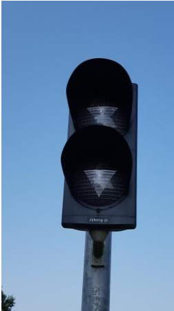
Permissivsignal an BÜ's