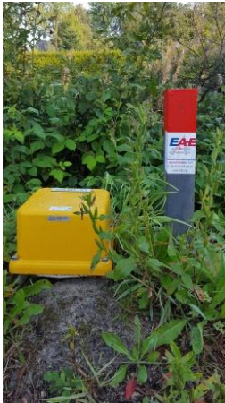
Kennzeichnung von Schleifen-Baugruppen und Kabelkästen