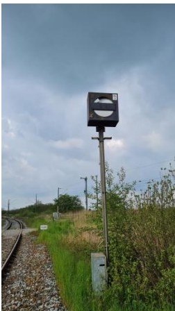
Signal Sh0/1 Bez. Hs3 im Ausfahrbogen